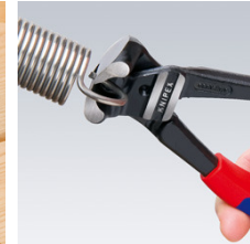
Capacité de coupe élevée, même avec de la corde à piano

Sous réserve de toute modification technique et erreur.