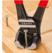
Sectionnement pratiquement à ras des boulons, clous, etc.